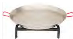
Set de paella avec poêle 80 cm