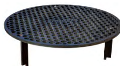
Grille HONEY ACC 9.1