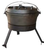
Four hollandais ACC 12