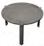
Plaque de cuisson surélevée ACC 13