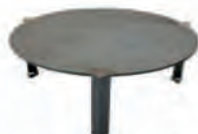
plaque de cuisson surélevée 40 pour 88 ACC 08