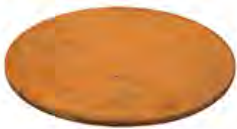
Couvercle TFC 88