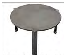
Plaque de cuisson surélevée ACC 13.2