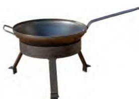
Set de wok ACC 10.2