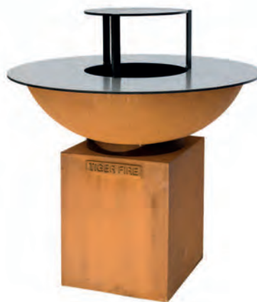
LARGE AVEC PLAQUE DE CUISSON SURÉLEVÉE

Le plus grand modèle de la gamme avec son diamètre de 112 cm. L'apparence élégante et solide s'adapte à n'importe quelle terrasse, de l'hospitalité aux terrains privés. Chef professionnel exigeant ou amateur passionné? Chacun trouvera la capacité et la convivialité qu'il souhaite avec cet appareil.