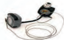
BBQ GURU Controller ACC 11