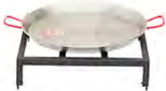
Set de paella avec poêle 60 cm ACC 14