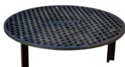
Grille HONEY ACC 9.2