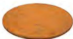
Couvercle TFC 88