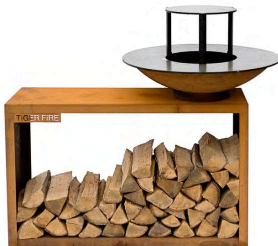
STORAGE 88 avec plaque de cuisson surélevée