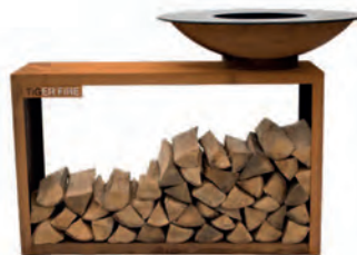
STORAGE ROND SANS PLAQUE DE CUISSON SURÉLEVÉE