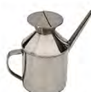
Bidon d'huile d'olive 0,7l ACC 2