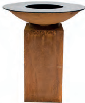
MEDIUM SANS PLAQUE DE CUISSON SURÉLEVÉE