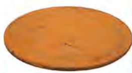
Couvercle TFC 112