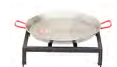
Set de paella avec poêle 60 cm