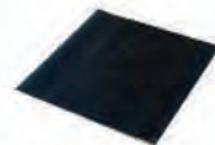
Tapis anti-contact pour rond 112 pied carré ACC 16