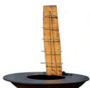
Plateau de saumon ACC 6