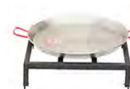
Set de paella avec poêle 60 cm ACC 14.1