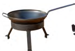
Set de wok ACC 10.1