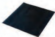
Tapis anti-contact pour rond 88 pied carré ACC 13