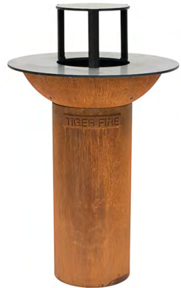
MINI avec plaque de cuisson surélevée

Grâce à sa conception compacte, il est prêt à l'emploi en seulement 10 à 15 minutes.