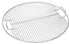
Grille en acier inoxydable ACC 8.2