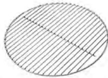
Grille en acier inoxydable ACC 8