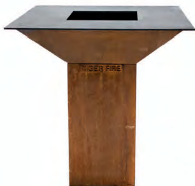
SQUARE SANS PLAQUE DE CUISSON SURÉLEVÉE

Le design carré atypique du Square attire l'attention sur n'importe quelle terrasse avec son aspect élégant et moderne. La plaque de cuisson de 100 cm x 100 cm vous permet d'avoir une capacité suffisante pour tous vos invités, jusqu'à 70 personnes.