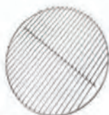
Grille pour mini en acier inoxydable ACC 01-2