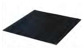
Tapis anti-contact ACC 16.4