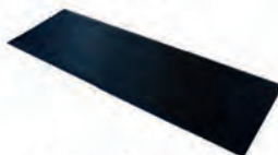
Tapis anti-contact pour rond 88 pied rond ACC 14