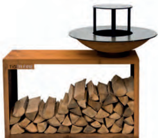
STORAGE ROND AVEC PLAQUE DE CUISSON SURÉLEVÉE

Un rangement pratique en bois et un plan de travail en un. Ceci peut être combiné avec la plaque de cuisson medium 88.