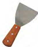
Spatule ACC 1