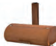
smoker modèle de luxe excl BBQ GURU Controller ACC 10