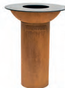
MINI SANS PLAQUE DE CUISSON SURÉLEVÉE