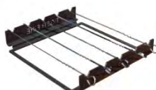
Grille de brochette ACC 7