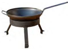
Set de wok ACC 10