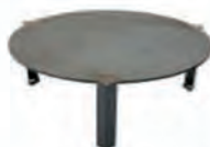
plaque de cuisson surélevée 46 (pour modèle hospitalité 112) ACC 09