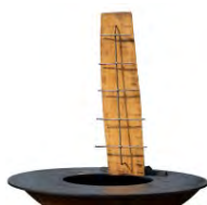
Plateau de saumon ACC 6