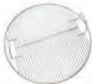
grille modèle 88 en acier inoxydable ACC 01-1