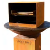
Four à pizza ACC 5