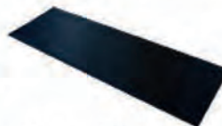
Tapis anti-contact pour storage ACC 15