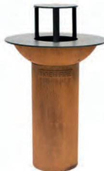
MINI AVEC PLAQUE DE CUISSON SURÉLEVÉE

Grâce à sa conception compacte, il est prêt à l'emploi en seulement 10 à 15 minutes.