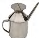
Bidon d'huile d'olive 0,7l ACC 2