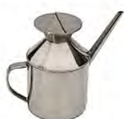
Bidon d'huile d'olive 0,7l ACC 2