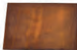
couvercle square 100 TFC 100