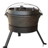
Four hollandais ACC 12.1