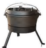
Four hollandais ACC 12.1