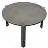
Plaque de cuisson surélevée ACC 13.1