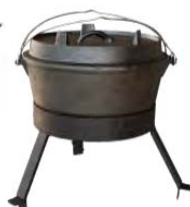
Four hollandais ACC 12.2