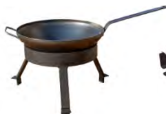
Set de wok ACC 10.1