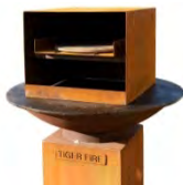
Four à pizza ACC 5