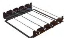
Grille de brochette