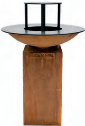
MEDIUM AVEC PLAQUE DE CUISSON SURÉLEVÉE

Un appareil avec une plaque de cuisson ronde de 88 cm. Son design fin lui permet de prendre peu de place sur votre terrasse. Cela permet à tout le monde de se tenir autour du feu et de cuisiner ensemble. Ce modèle a une capacité suffisante pour un usage privé et pour des groupes jusqu'à 30 personnes.