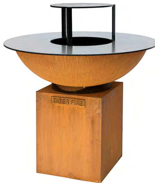
LARGE avec plaque de cuisson surélevée

Le plus grand modèle de la gamme avec son diamètre de 112 cm. L'apparence élégante et solide s'adapte à n'importe quelle terrasse, de l'hospitalité aux terrains privés. Chef professionnel exigeant ou amateur passionné? Chacun trouvera la capacité et la convivialité qu'il souhaite avec cet appareil.