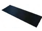
Tapis anti-contact ACC 16.3