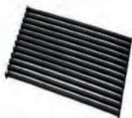
Grille pour modèle square ACC 02