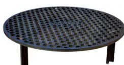
Grille HONEY ACC 9.1